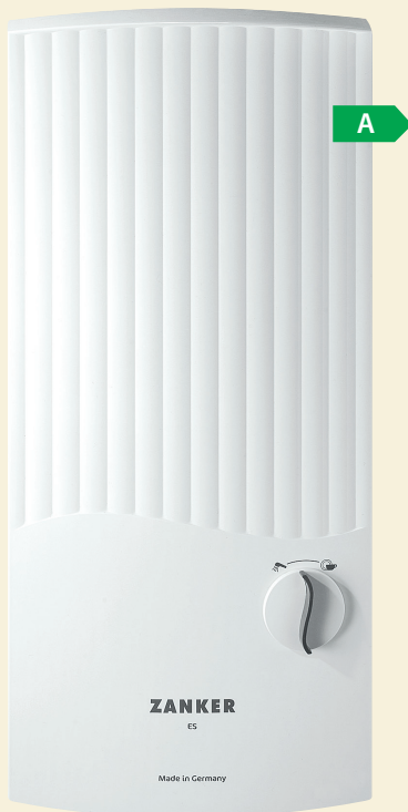
DE ... ES

Die Steuerelektronik des DE ES sorgt für eine hohe Temperaturkonstanz. So steht sofort und unbegrenzt warmes Wasser an einer oder mehreren Wasserstellen in Wohnungen und Einfamilienhäusern bereit. Zwei Festtemperaturen sind am Drehregler durch eindeutige Anwendungssymbole wählbar.