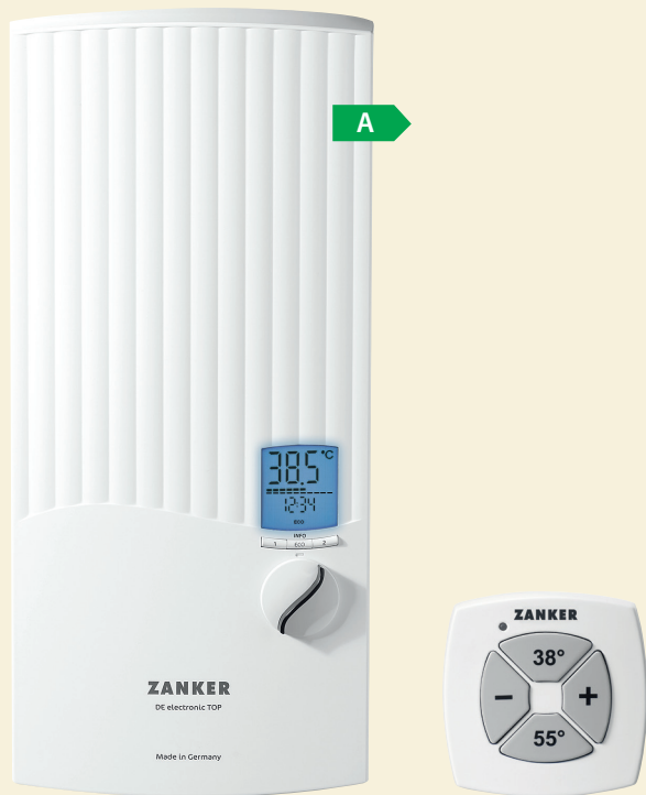
DE 24 EL TOP

Durchflussmenge, gradgenaue Temperatur, Wellnessprogramme, u.v.m. sind individuell einstellbar und über das Multifunktions-Farbdisplay jederzeit im Blick. Mit dem DE 24 EL TOP können bis zu 140,- €/Jahr Energiekosten gegenüber hydraulischen Geräten gespart werden.