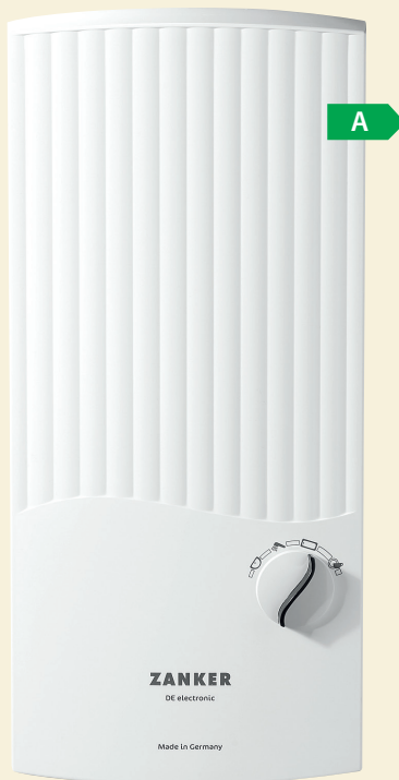
DE 24 EL

was sich aufgrund der langen Lebensdauer besonders rechnet. Elegantes Design und geringe Aufbauhöhe (hier nur 93 mm) gehören bei allen elektronisch geregelten ZANKER-Durchlauferhitzern zum Standard.