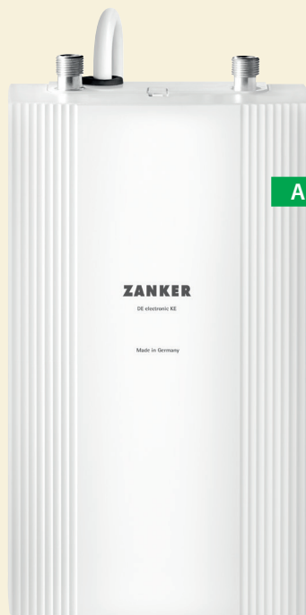
DE 13 KE

macht. Dank seines einzigartig flachen Kompaktformats (293 mm hoch, 174 mm breit und 87 mm tief) findet er seinen Platz sogar unter der kleinsten Küchenspüle oder dem Handwaschbecken.