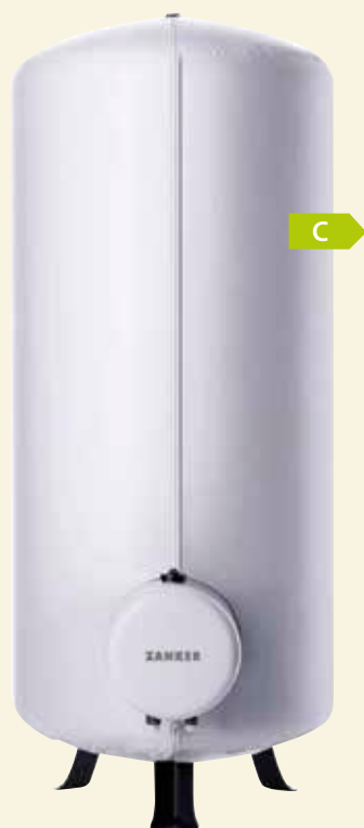
SGZ 200 C bis SGZ 400 C

Verarbeitung und Wärmedämmung der SGZ Standspeicher sorgt für einen wirtschaftlichen Betrieb über viele Jahre.