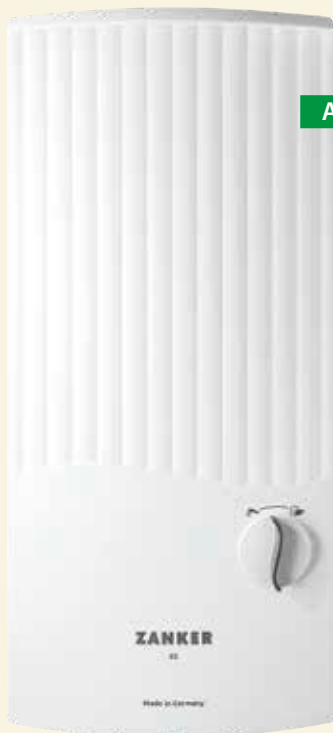
DE ... ES

Die Steuerelektronik des DE ES sorgt für eine hohe Temperaturkonstanz. So steht sofort und unbegrenzt warmes Wasser an einer oder mehreren Wasserstellen in Wohnungen und Einfamilienhäusern bereit. Zwei Festtemperaturen sind am Drehregler durch eindeutige Anwendungssymbole wählbar.