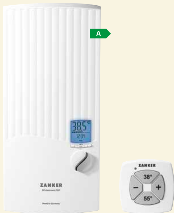
DE 24 EL TOP

Durchflussmenge, gradgenaue Temperatur, Wellnessprogramme, u.v.m. sind individuell einstellbar und über das Multifunktions-Farbdisplay jederzeit im Blick. Mit dem DE 24 EL TOP können bis zu 140,- €/Jahr Energiekosten gegenüber hydraulischen Geräten gespart werden.